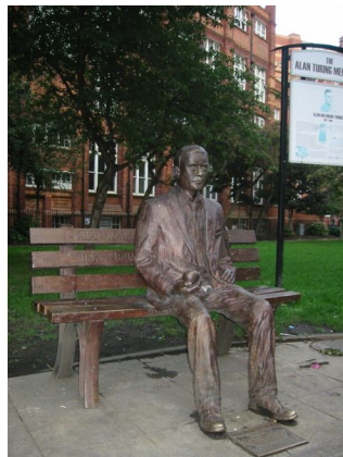
Pomnik w Manchester