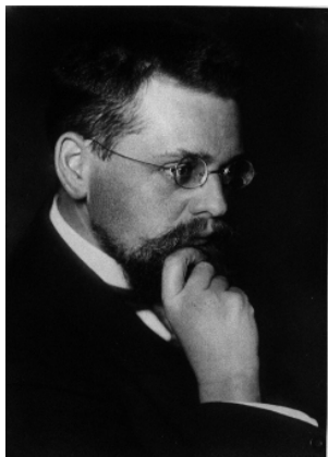
Ernst Zermelo (1871–1953)